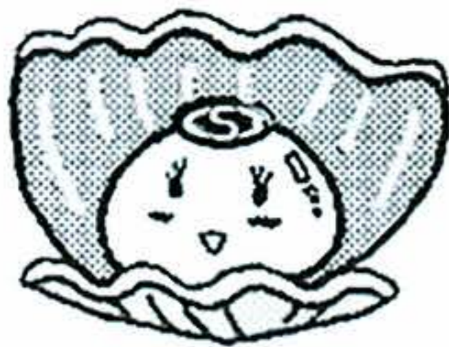
三重県大会のイメージキャラクター『パールちゃん』

真珠養殖発祥の地が伊勢志摩地方であることから誕生しました。パールちゃんは、「4つのP」であるPure(純粋、純潔)、Peer(仲間)、Peace(平和、安心)、Pride(誇り)の輝きを持っています。(パールマンを慕っています) 私達、社会福祉士にとっても大切なものではないでしょうか。三重大会で、社会福祉士の輝きを見つけてください。そして、共に輝ける社会福祉士を目指しましょう!