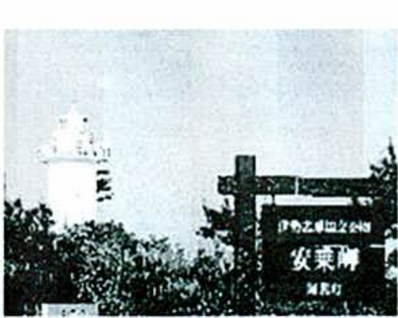
→安乗埼(あのりさき)灯台

高台に登り海を見渡せば、紺碧の海とリアス式海岸の複雑な海岸線が展望できることでしょう。伊勢志摩地方には幾つかの展望台があり、風光明媚な景色が堪能できます。天気の良い日には、何と富士山を望むことができます。